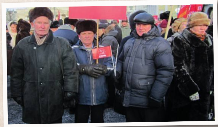
Руководители Правления Ленинского районного отделения МОО «Дети войны» на митинге в Москве с требованием принятия Закона о военном поколении