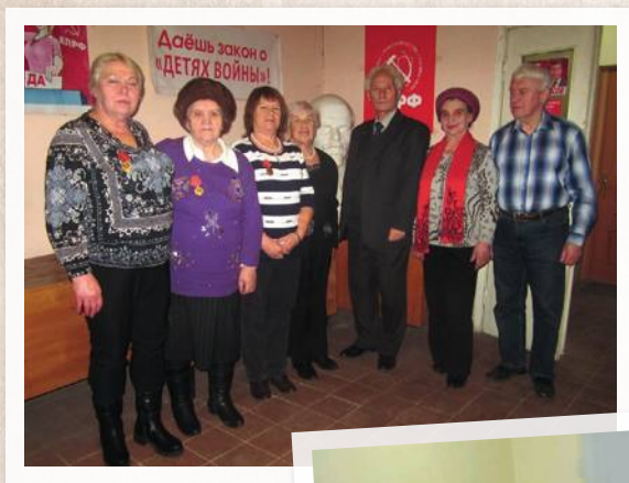
Члены Правления Ленинского район- ного отделения МОО «Дети войны»