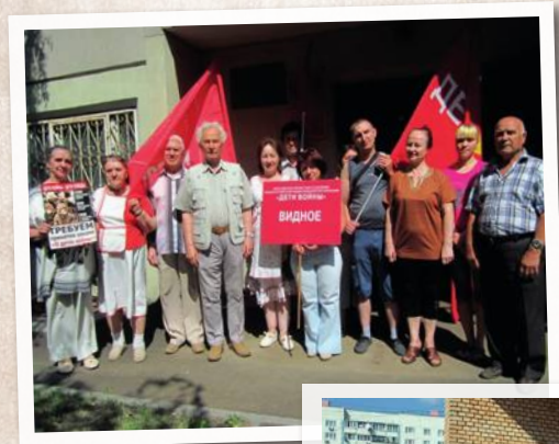
Коллективное фото после очередного заседания Правления Ленинского районного отделения МОО «Дети войны»