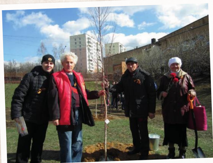
«Дети войны» Ленинского района приняли активное участие в посадке деревьев за кинотеатром «Искра»