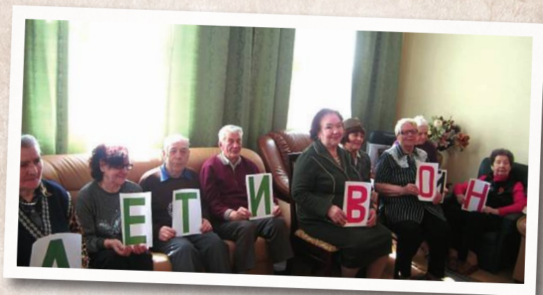
Встреча «детей войны» в Ленинском комплексном центре социального обслуживания населения «Вера»