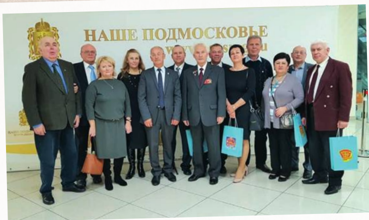
Делегация Ленинского района на 100-лети Комсомола в Доме правительства Московской области