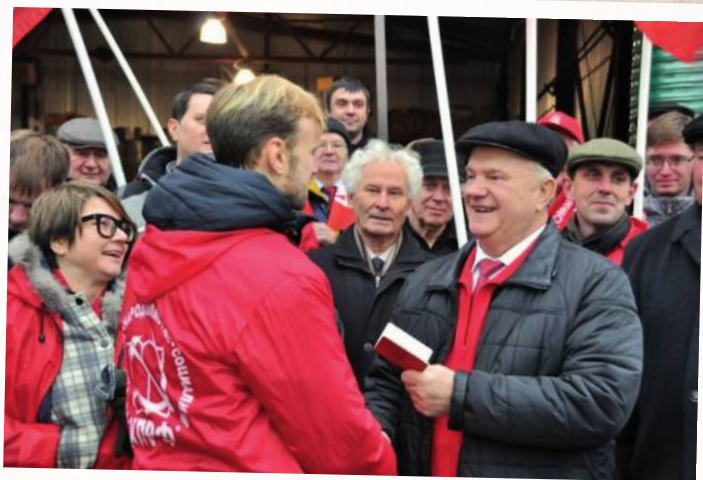
На отправке гуманитарной помощи на Донбасс из совхоза имени Ленина