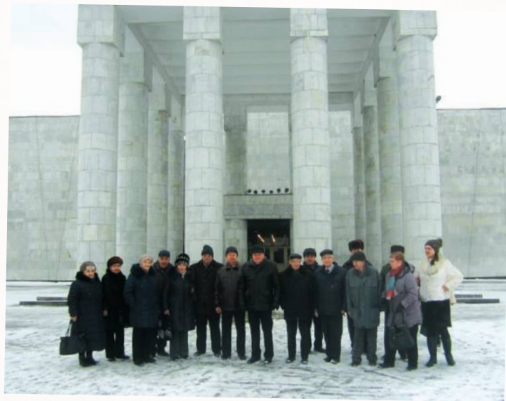
На 70-летие Музея В. И. Ленина в Горках приехали «дети войны» Ленинского района