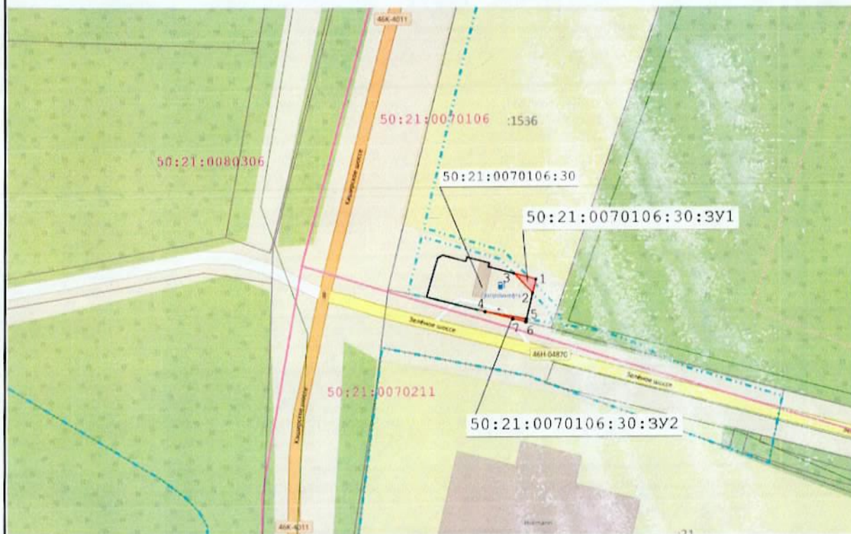
Масштаб 1:2 000

Приложение 1 к распоряжению Министерства транспорта и дорожной инфраструктуры Московской области от 03.02.2013 № 91-Р