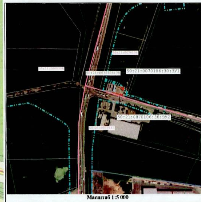
Масштаб 1:5 000