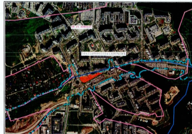
Масштаб 1:10 000