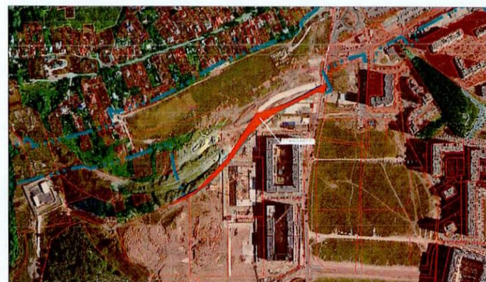
Масштаб 1 : 8 000