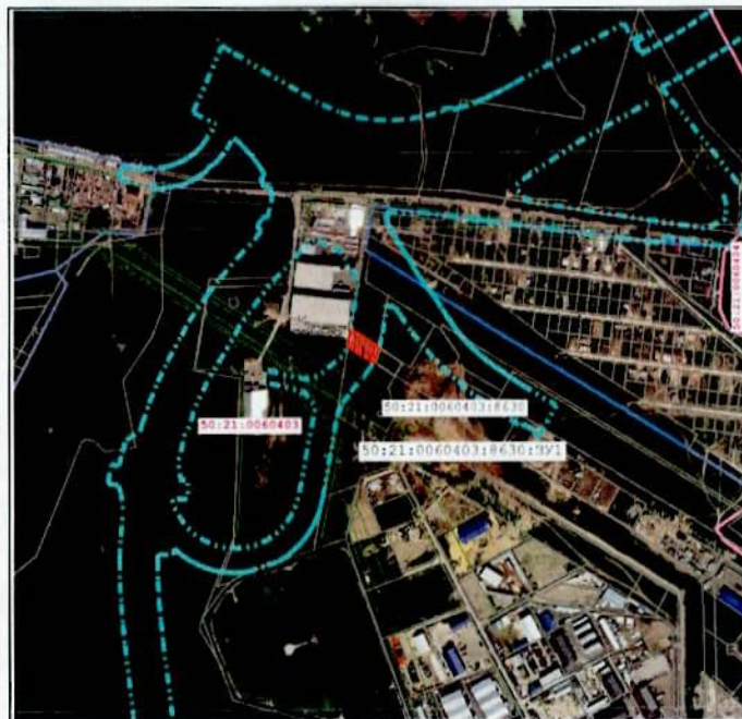
Масштаб 1:10 000