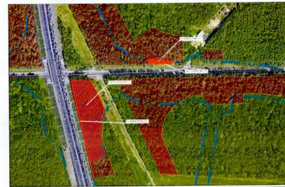
Масштаб 1 : 8 000