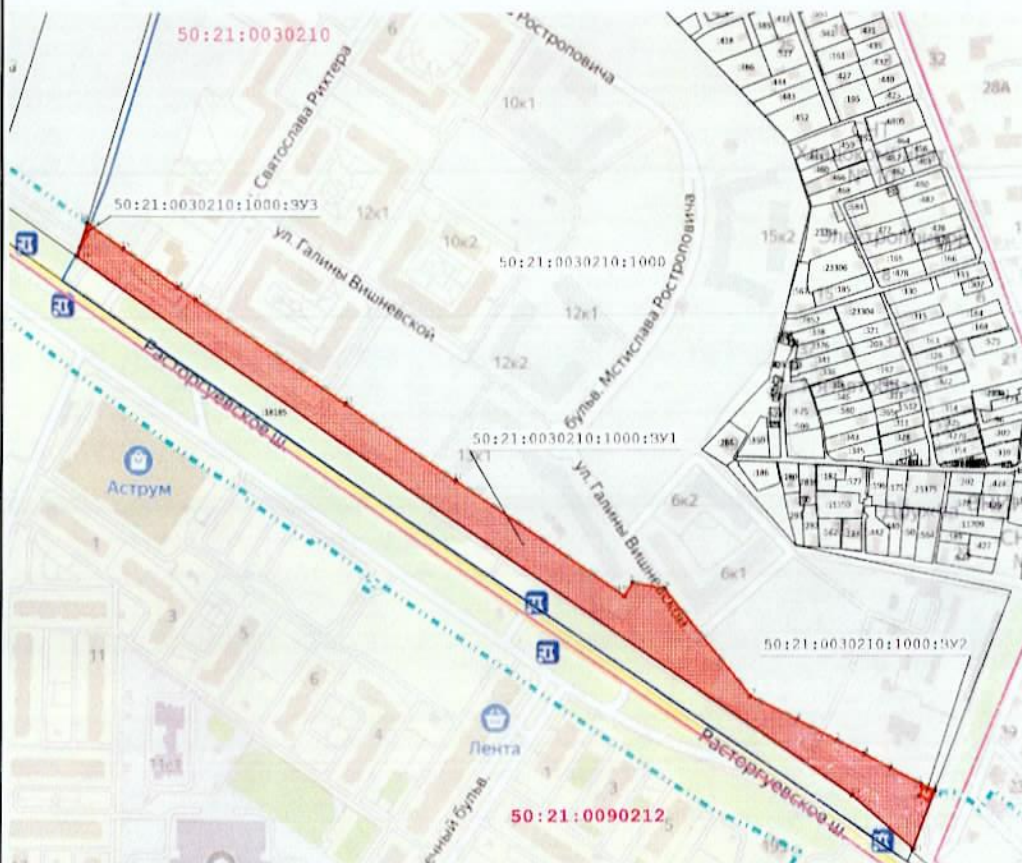
Масштаб 1:4 000