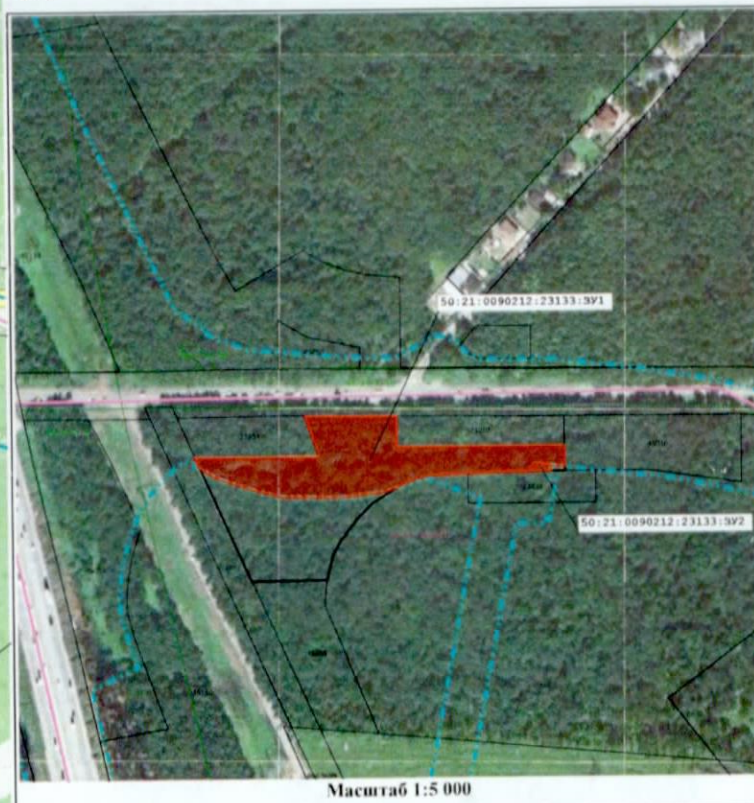
Масштаб 1:5 000