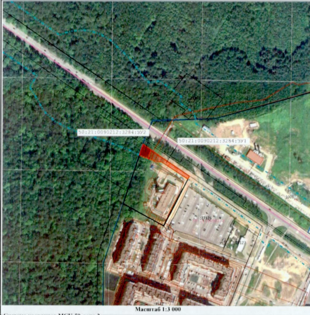
Масштаб 1:3 000