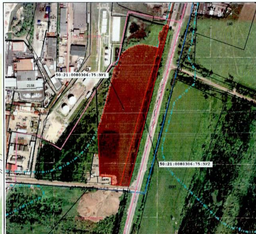
Масштаб 1:5 000