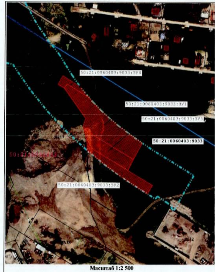
Масштаб 1:2 500