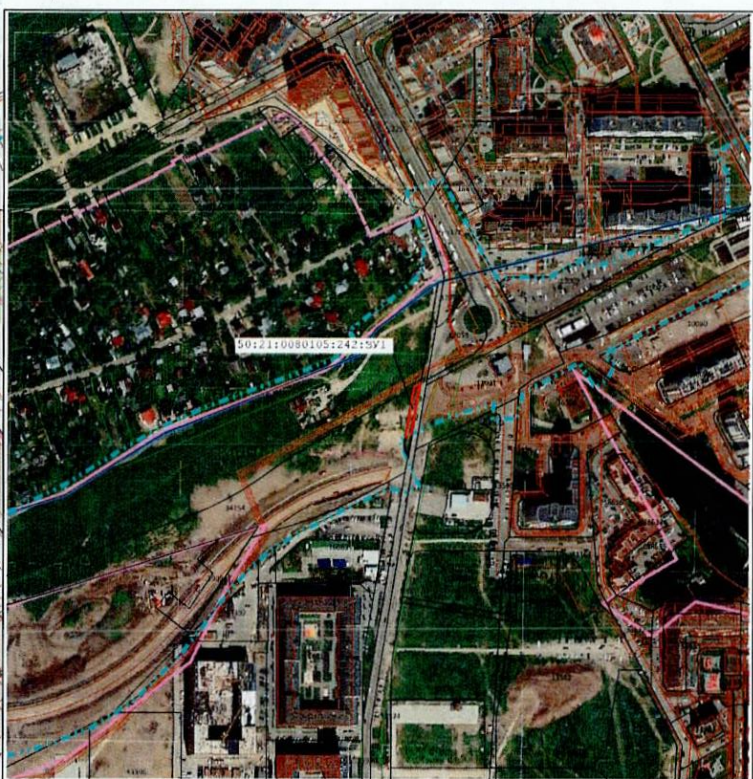
Масштаб 1:5 000