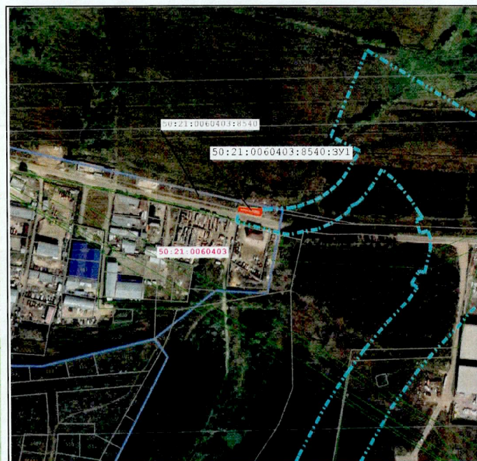
Масштаб 1:5 000