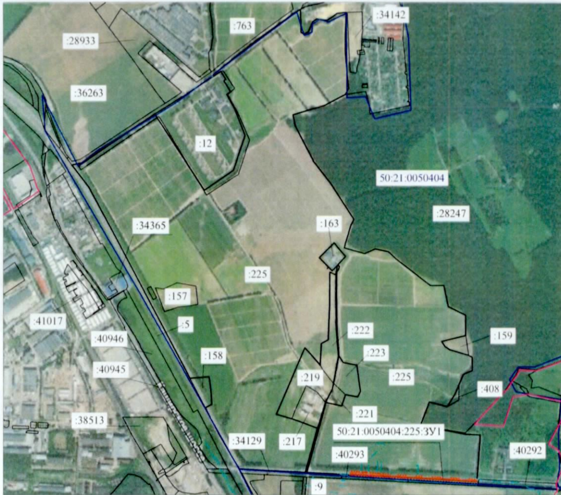
Масштаб 1:20 000 Система координат - МСК-50, зона 2