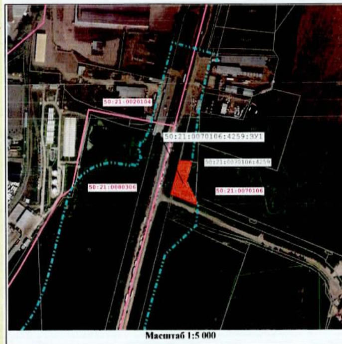
Масштаб 1:5 000