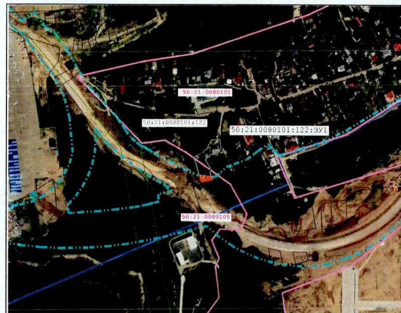
Масштаб 1:5 000